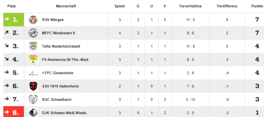
Tabelle Frauen Gruppeliga (Stand: 04.10.22)